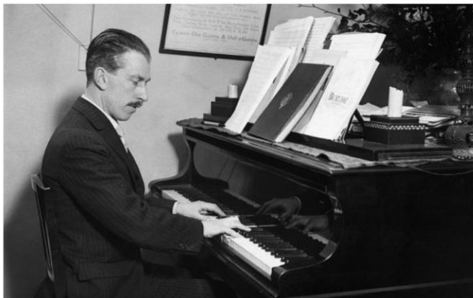
Артур Блісс. 1930-ті роки

Одне з провідних місць у творчому доробку А. Блісса належить фортепіанній музиці. Ще з юних літ фортепіано було для нього не просто улюбленим інструментом 1 , а своєрідною лабораторією, у якій народжувалися перші музичні ідеї, формувалися індивідуальні риси композиторського стилю та відкривалися нові звукові горизонти. Такий підхід простежується у творах раннього періоду композитора. Вони позначені прагненням практично засвоювати набутий під час навчання досвід, апробувати різні композиторські техніки і стилі, творчо реалізувати свій значний слуховий багаж, — що й спонукало А. Блісса до синтезу різноманітних музичних засобів. У цьому контексті надзвичайно показовою є фортепіанна сюїта 2 «Маски» («Masks», 1924), у якій автор майстерно поєднує камерний формат вислову з масштабністю й картинністю художнього задуму.