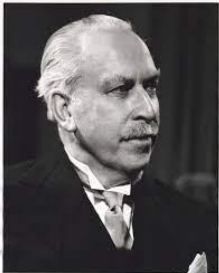
Артур Блісс. 1954 рік

Артура Блісса стали ініціаторами проведення численних концертів і фестивальних виступів, присвячених виконанню творів композитора 1 .